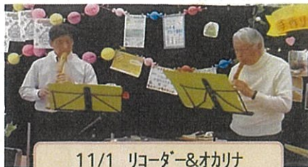
11/1 リコーダー&オカリナ