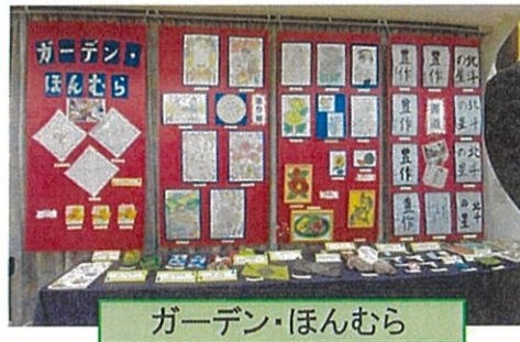
ガーデン・ほんむら