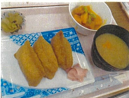
11/3 けんちの里の食事