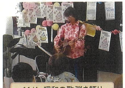
11/4 昭和の歌弾き語り