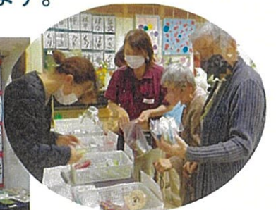
お客様の作品の販売も行いました。