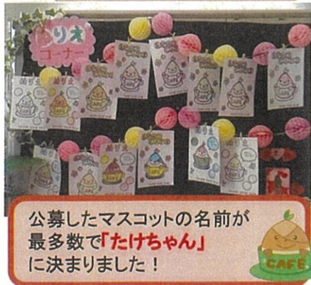
公募したマスコットの名前が 最多数で「たけちゃん」 に決まりました！